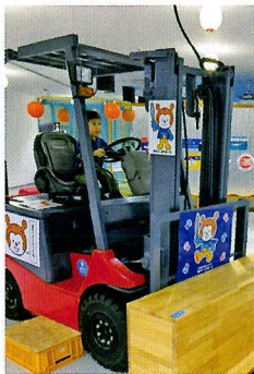
水産情報等発信施設のフォークリフト

気仙沼魚市場二階の水産情報等発信施設には漁師の仕事を知る資料や模型が展示してあります。実際にフォークリフトに乗って魚市場の水揚げ現場を仮想体験したり、漁船プロジェクトジョンマップングではさまざまな漁業の工夫を楽しめるミニチュアアニメで学ぶことができます。