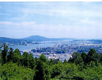
安波山から気仙沼を望む

気仙沼を一望するには「安波山」や「復興祈念公園」からおおすすめです。気仙沼湾や港、二つの大橋を眺めることができます。湾内に走り込む漁船の姿に気仙沼らしさを一層感じていただけます。